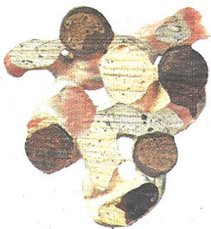
Obra reciente de Enrique Radigales

La obra de Enrique Radigales (Zaragoza, 1970) es un claro exponente del proceso de actualización que toda práctica artística necesita para seguir existiendo plena: no por atender a una suerte de instinto de conservación disciplinaria, sino como respuesta que desde una cierta especificidad (lo pictórico, en este caso) pueda ofrecer el artista a los retos conceptuales de su época. Para ello, Radigales ha venido llevando a cabo una serie de estrategias de cruce o hibridación, de encuentro crítico, problemático incluso, entre una concepción básica de la pintura y los medios tecnológicos, dando lugar a un tipo de obra de carácter excepcionalmente moderno, en el sentido cabal de la palabra. Imágenes, las suyas, enigmáticas, radicales en su heterogénea e inaudita formulación y nada fáciles de asimilar. Imágenes que, como en The Goma , demandan ser consideradas de manera compleja, al requerir un agudo ejercicio perceptivo por parte del espectador. Síntoma evidente de su incontestable actualidad. ♦ Enrique Radigales La cuarta generación ★★★ GALERÍA THE GOMA. MADRID. C/ FÚCAR, 12. HASTA EL 13 DE FEBRERO