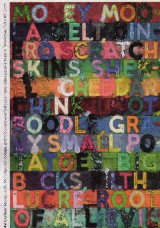
Mel Bochner, Money, 2015. Monotipo con collage, grabado y relieve entintado a mano sobre papel artesanal Twinrocker, 160 x 109,2 cm.