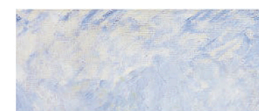
1881 Pierre-Auguste Renoir Piazza San Marco, Venice